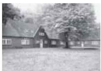
Nicos Farm: Diese Wohnanlage in Hamburg bietet Platz für 20 Familien mit behinderten Kindern. Der Verein würde sie gern kaufen.