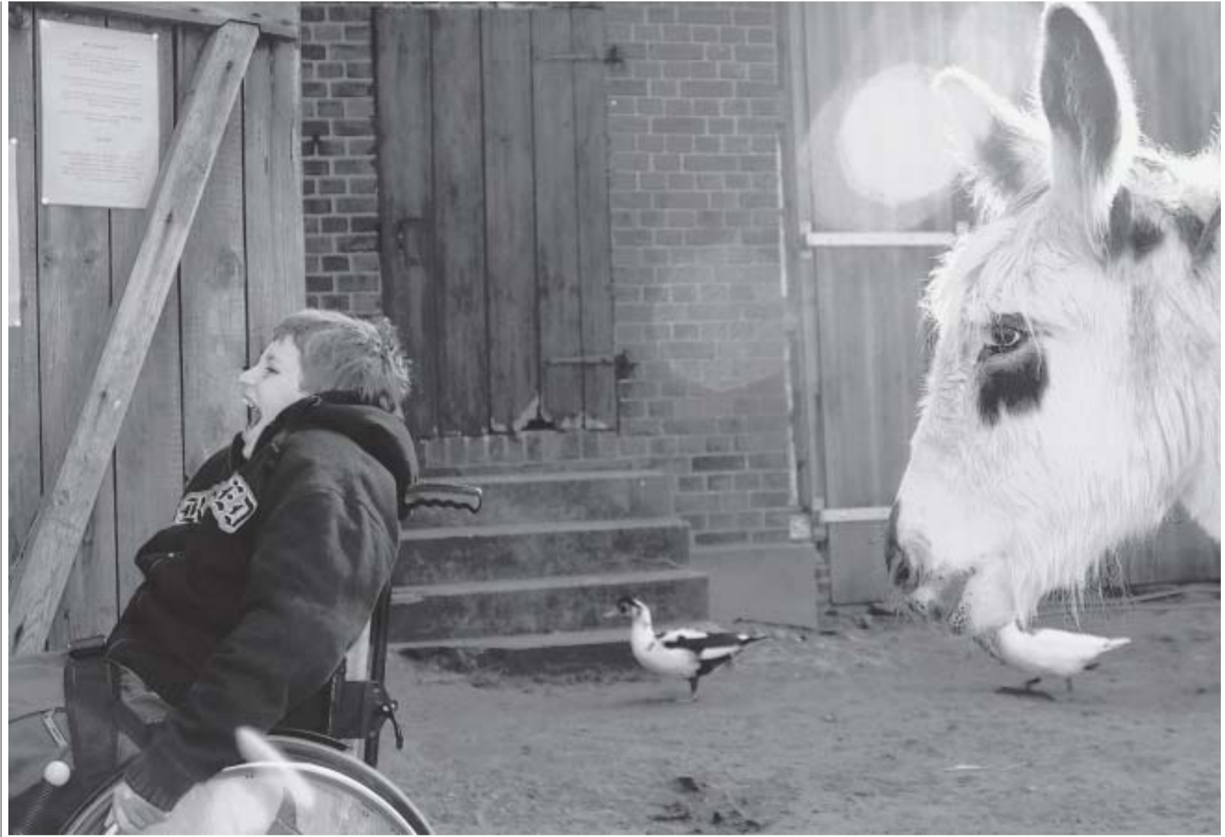
„Es ist einfach schön, wenn er sein Leben genießt und keine Probleme kennt“: Der schwerbehinderte Nico liebt den Umgang mit Tieren.