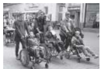
Von Hamburg ins Ruhrgebiet: Die Wanderaktion ging im Mai vorbei an Bielefeld und Rheda. Sie soll 2010 wiederholt werden.